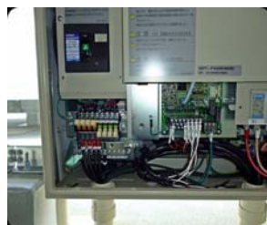
パワーコンディショナ