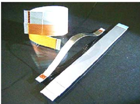
*0.5mmピッチ・厚さ0.035mm *LVDS、USB信号等高速差動伝送 基板間の接続に！